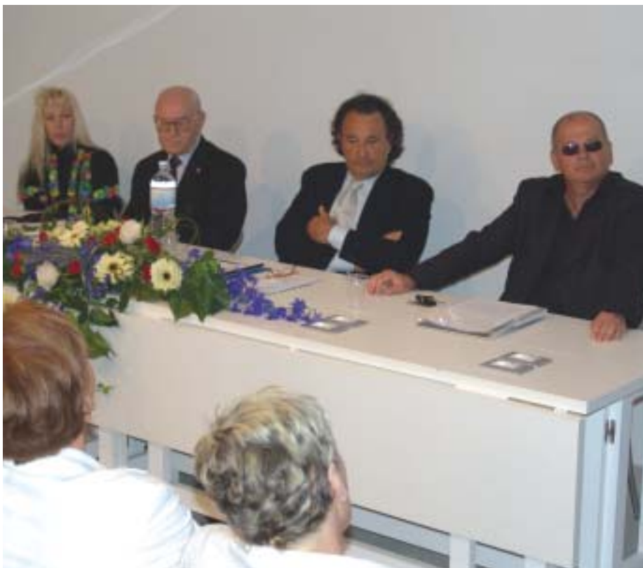
A sinistra, i componenti del tavolo di presidenza.

Poi ancora proseguire nel trasferimento di alcuni servizi alla Cooperativa “Orion”, strumento importante per l'inserimento lavorativo delle persone disabili.